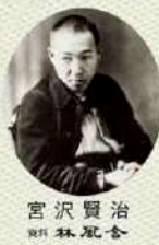
宮沢賢治 著 林 風舎

岩手を「イーハトーブ(理想郷)」と呼んだ宮沢賢治の生誕地として知られる花巻は、国際新渡戸稲造や詩人彫刻家高村敏太郎ゆかりの地でもあり、彼らの軌跡はここ花巻のいたるところにあります。 この地で90年以上の歴史を持ち、創業当時から教育旅行に取り組んでいる経験と豊富なノウハウは、花巻温泉だからこそのです。 岩手は多くの偉人が生まれ、立ちよ、文化遺産を残した歴史の町、そしてなにより「風土の豊かさ」人の優しさに満ち溢れております。豊かで魅力のある町花巻に「おでんせ」。