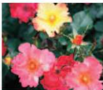
カクテルローズ (2010年) Cocktail rose