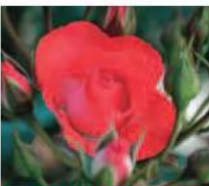
花巻おとめ80 (2007年) Hanamaki Otome 80