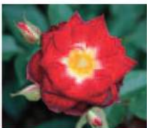
花巻美人80 (2007年) Hanamaki Bijin 80