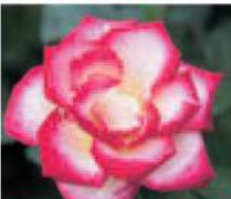
ハッピーローズ88 (2015年) Happy Rose 88