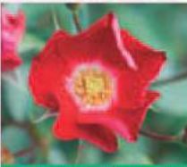
ホッツプリングス (1996年) Hot Springs