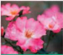
ホット花巻 (1996年) Hot Hanamaki