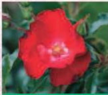
ホット羽山 (1998年) Hot Hayama