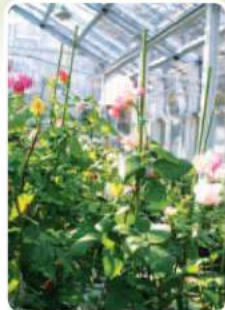
温室のバラは3月頃から咲きはじめます。