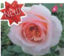
NEW ミラクルローズ90 (2017年) Miracle Rose 90