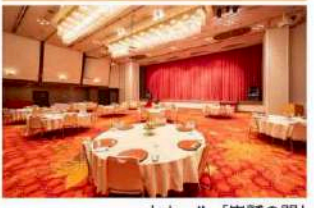
大ホール「巖鷲の間」