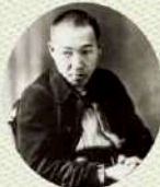
宮沢賢治 著 林 風 舎

岩手は多くの偉人が生まれ、立ちよみ、文化遺産を残した歴史の町、そしてなにより「風土の豊かさ」人の優しさに満ち溢れております。豊かで魅力のある町花巻に「おでんせ」。