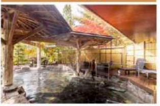
紅葉の湯 岩露天風呂